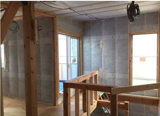
2階 断熱施工完了状況