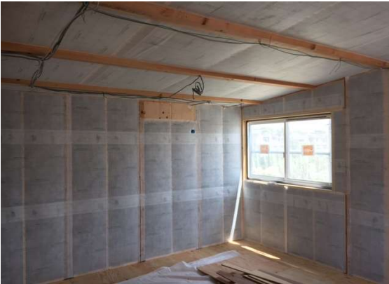
2階 断熱施工完了状況