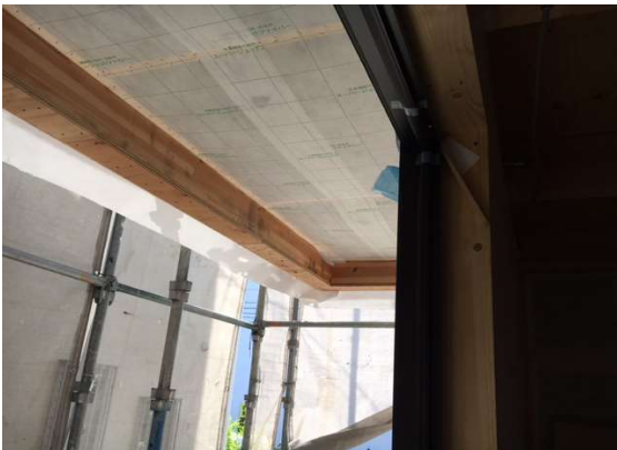
ポーチ部 部屋下 施工状況