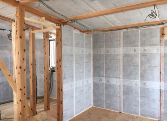
2階 断熱施工完了状況