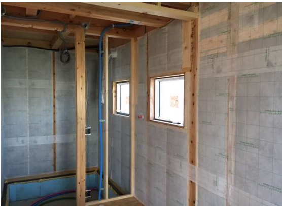
1階 断熱施工完了状況