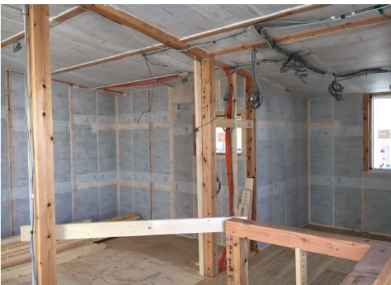
2階 断熱施工完了状況