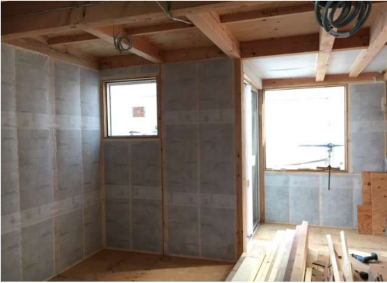
1階 断熱施工完了状況