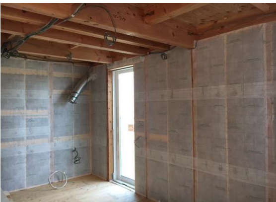
1階 断熱施工完了状況