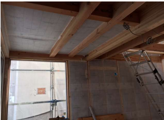
バルコニー下 施工状況