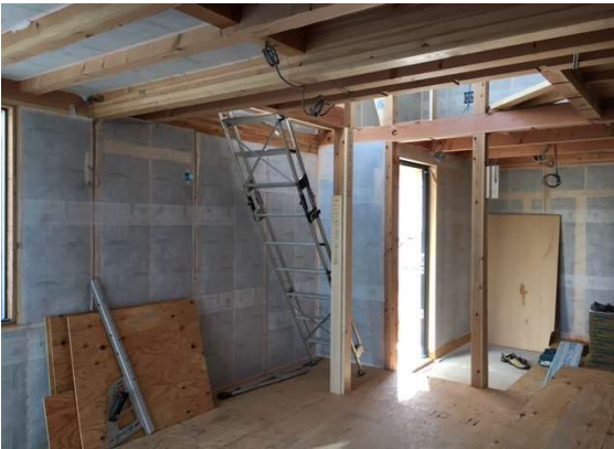
1階 断熱施工完了状況